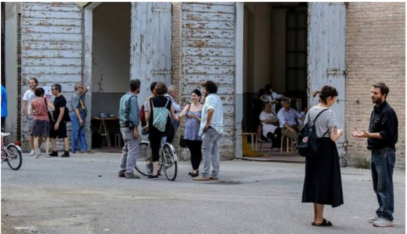
Open day a spazio Grisù (Samaritani)

Ultimo aggiornamento: 26 giugno 2017 ore 18:25